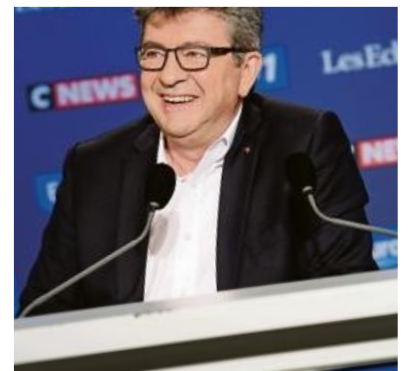
Comme les autres députés de La France insoumise, Jean-Luc Mélenchon ne se rendra pas au Congrès lundi 9 juillet à Versailles.